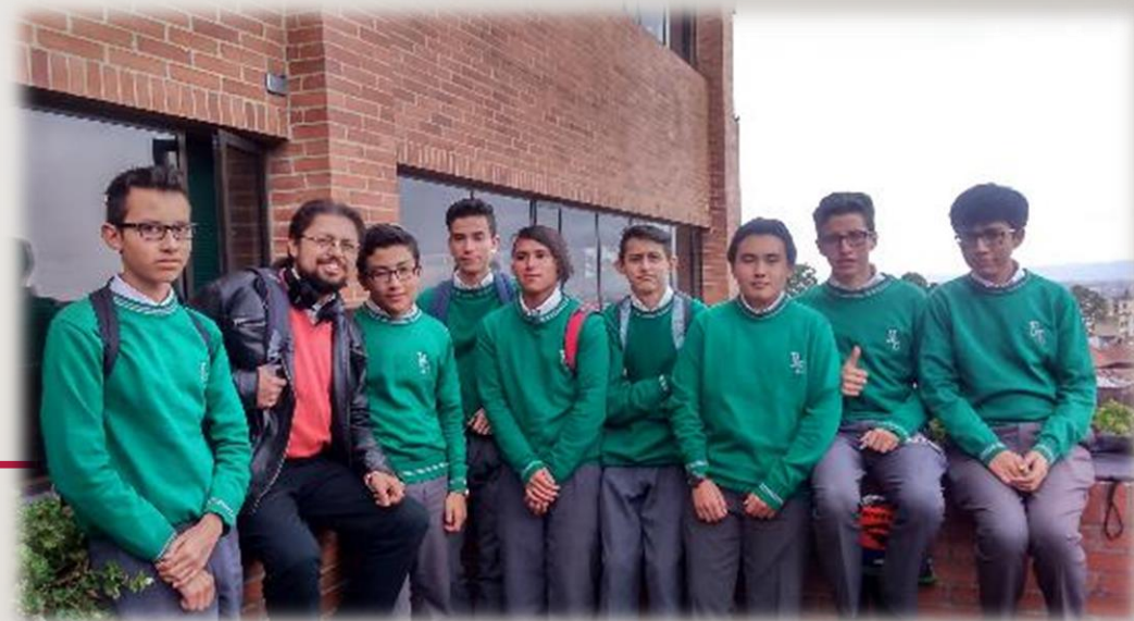
Visita a la Universidad Externado de Colombia, mayo de 2016

En una primera parte se analizan y socializan los temas, luego se plantean las preguntas problémicas a resolver e investigar y por último, se efectúan los ejercicios de escritura como generador de competencias básicas